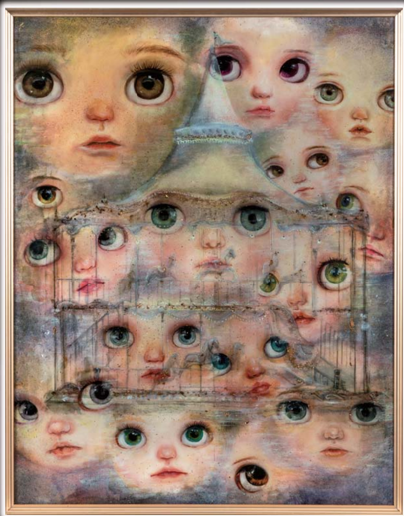
内閣総理大臣賞 「Nostalgia carousel」大西花愛 横須賀市立横須賀総合高等学校